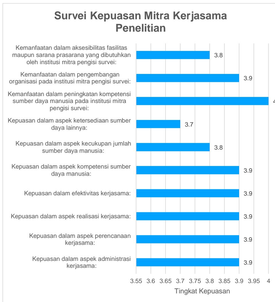
Gambar 1. Grafik hasil survei kepuasan mitra kerjasama penelitian 2024/2025.

Berdasarkan hasil tersebut, beberapa rekomendasi perbaikan dapat diberikan, seperti peningkatan ketersediaan sumber daya pendukung lainnya, optimalisasi jumlah sumber daya manusia yang terlibat, serta penguatan aspek administrasi dan komunikasi untuk mempertahankan tingkat kepuasan yang sudah tinggi. Temuan ini menjadi dasar penting bagi Program Studi Doktor Ilmu Pertanian, Fakultas Pertanian, Universitas Mulawarman, untuk terus meningkatkan kualitas kerja sama penelitian dengan mitra, sehingga dapat memberikan manfaat yang lebih besar bagi semua pihak yang terlibat.